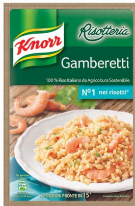
UNILEVER ITALIA Knorr Risotteria