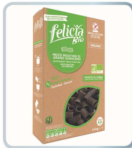
FELICIA Felicia Bio Linea Legumi