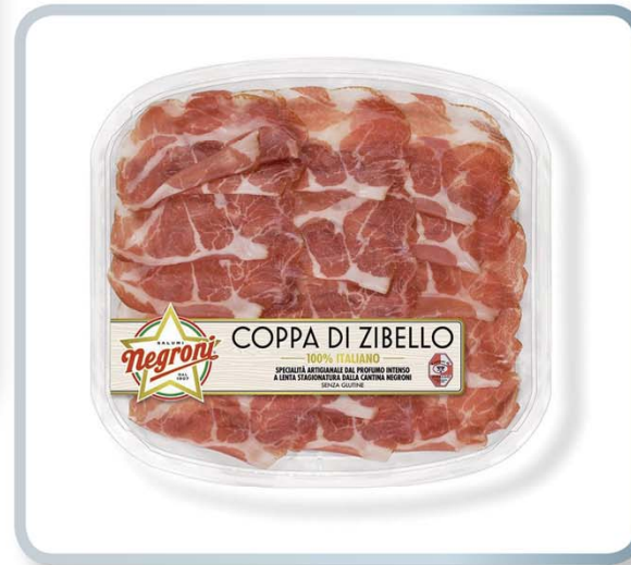
AIA - AGRICOLA ITALIANA ALIMENTARE Negroni Affettati Linea Essenza