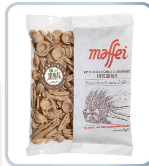
IL PASTAIO DI MAFFEI Pasta Fresca di semola 100% Integrale