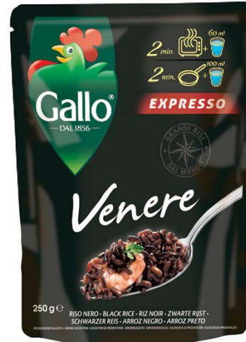
RISO GALLO Riso Express Benessere