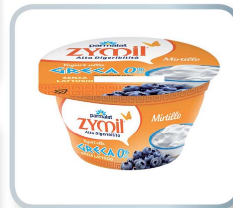
PARMALAT ITALIA Zymil yogurt alla greca