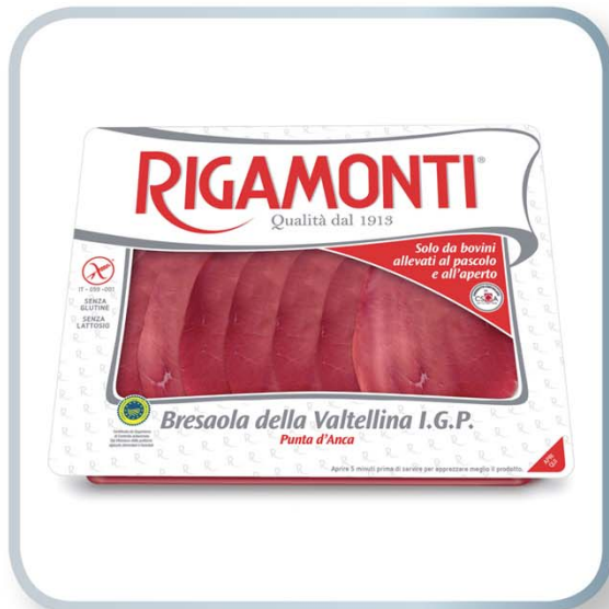
RIGAMONTI SALUMIFICIO Bresaola della Valtellina IGP Rigamonti