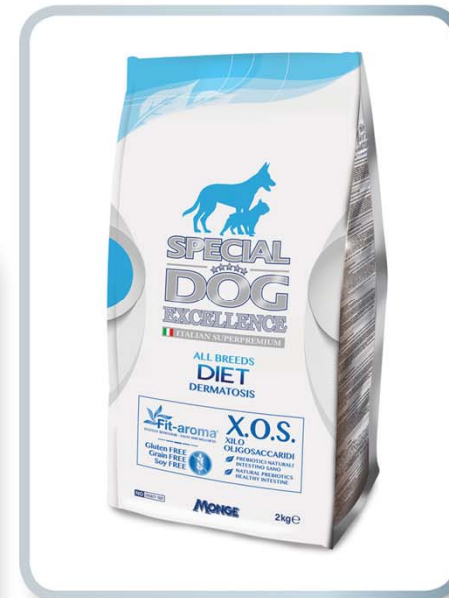
MONGE & C Special Dog Excellence