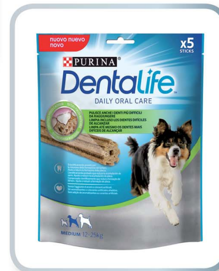
NESTLÉ ITALIANA SPA PURINA Dentalife snacks per cani