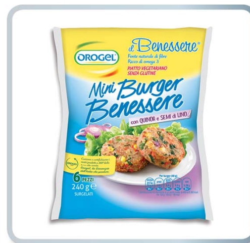
ORO GEL OroGel miniburger benessere