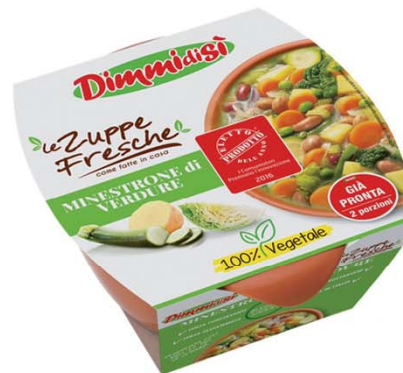
LA LINEA VERDE Dimmidisi Le Zuppe Fresche