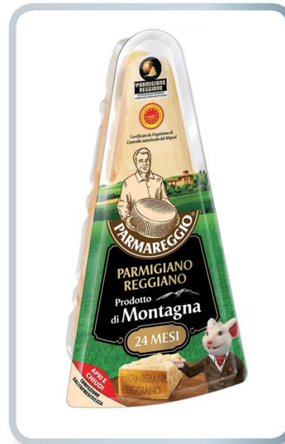
PARMAREGGIO Parmigiano Reggiano 24 Mesi di Montagna