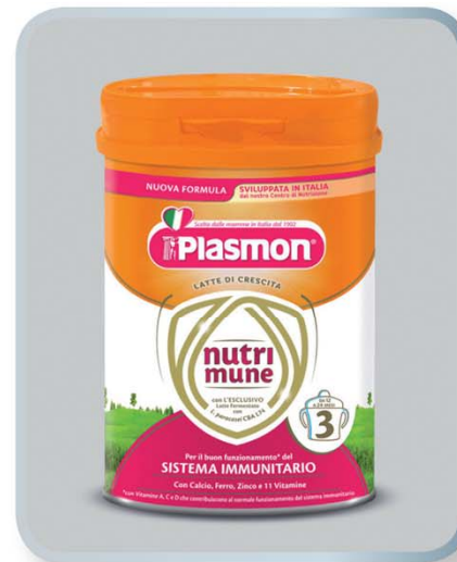
HEINZ ITALIA Plasmon Nutri-mune