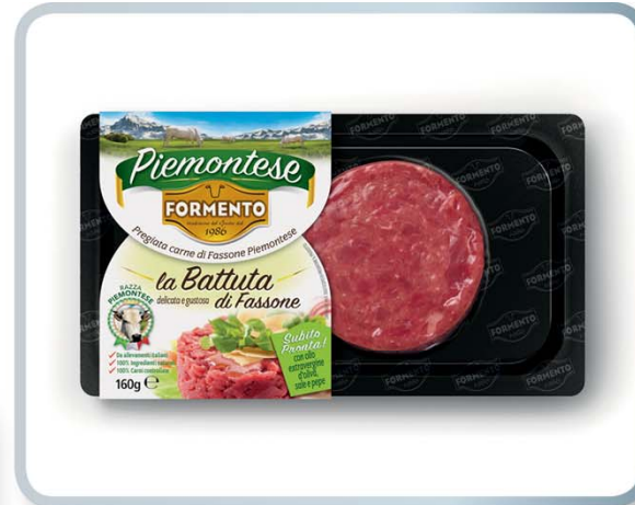
MEC SPA - INDUSTRIA ALIMENTARI CARNI Formento - linea piemontese skin