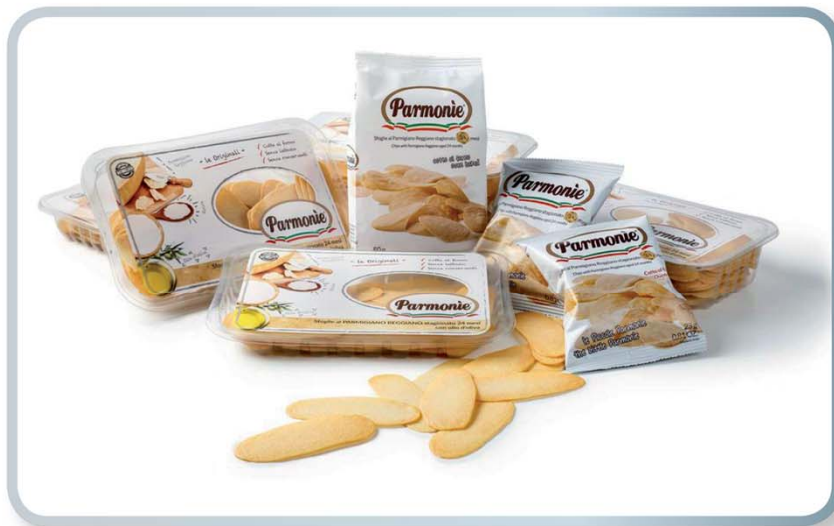
ARMONIE ALIMENTARI Parmonie