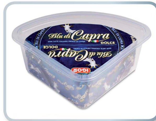
IGOR Igor blu di capra