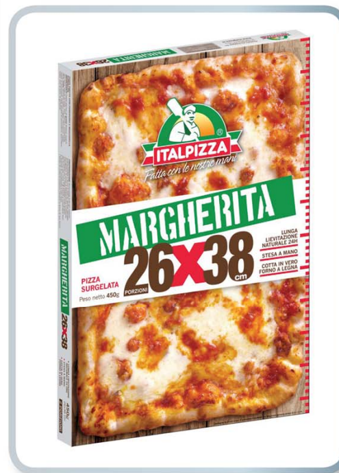
ITALPIZZA Italpizza 26x38