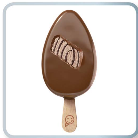
SAMMONTANA Non Mordere