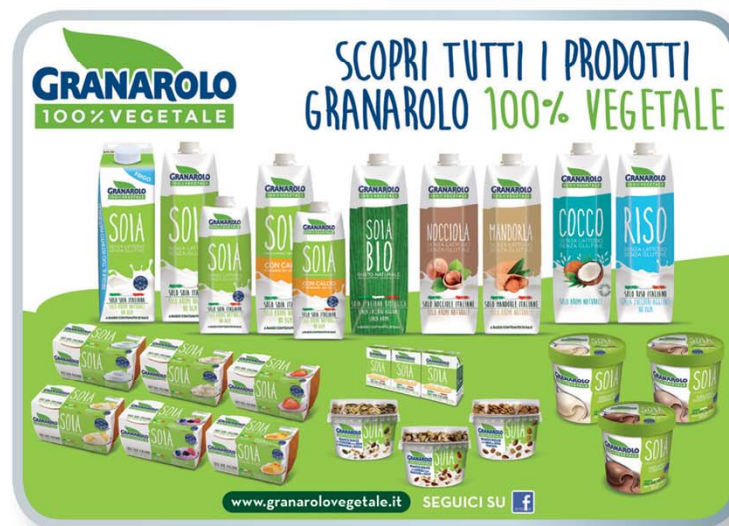
GRANAROLO Linea 100% vegetale yogurt vegetali