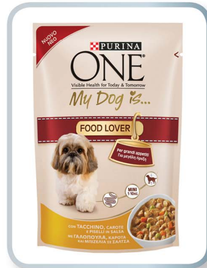
NESTLÉ ITALIANA SPA PURINA Purina ONE My dog is...