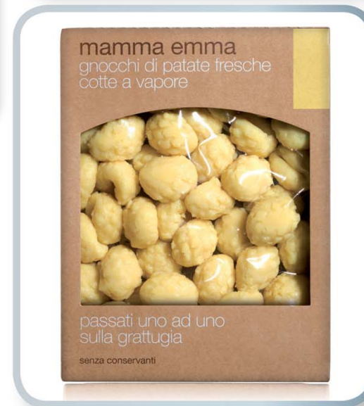
MASTER Mamma Emma gnocchi passati sulla grattugia